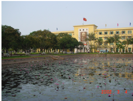
Nhà hành chính, Trường ĐH Nông nghiệp Hà Nội

Trung tâm Sinh thái Nông nghiệp (CARES) là một đơn vị trực thuộc trường Đại học Nông nghiệp Hà Nội. Trung tâm hoạt động phi lợi nhuận trong các lĩnh vực đào tạo, nghiên cứu và các hoạt động hỗ trợ khác.