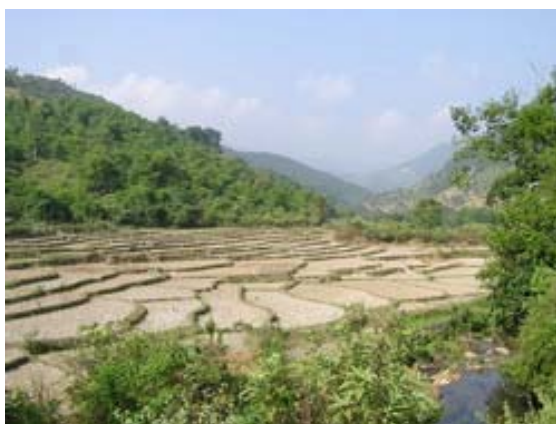
Ruộng bậc thang của người dân tộc Thái tại huyện Tương Dương, Nghệ An