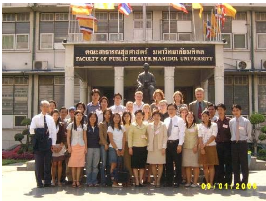
Giao lưu giữa sinh viên ĐHNHI và sinh viên Đại học Mahidol, Thái Lan